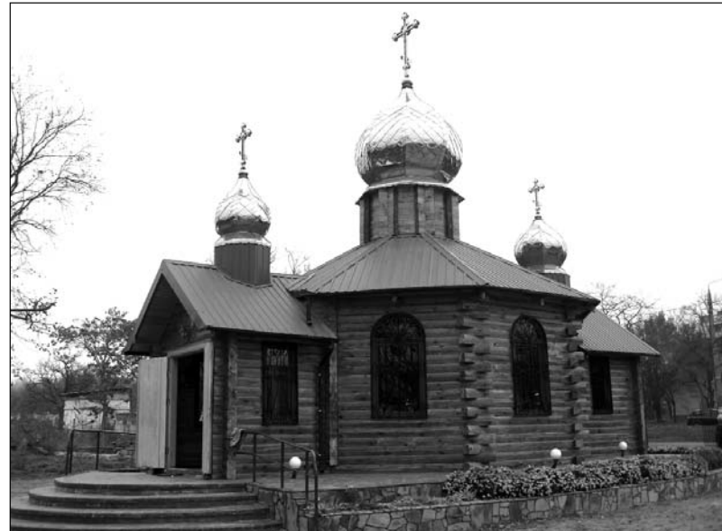
Храм святой равноапостольной Нины (мкр. Соляные, г. Николаев)

Храмы Божии на нашей земле всегда были и есть духовными центрами религиозно-нравственной жизни народа. И если рождались города или селения, то первой наши предки строили церковь. Этим конечно же выражались и любовь к Богу, и непоколебимое желание жить по Его заповедям, и благоговейное и ревностное служение храму и своим ближним, и постоянная забота о своем спасении. Думая о вечности, наши предки устремляли свои помыслы и