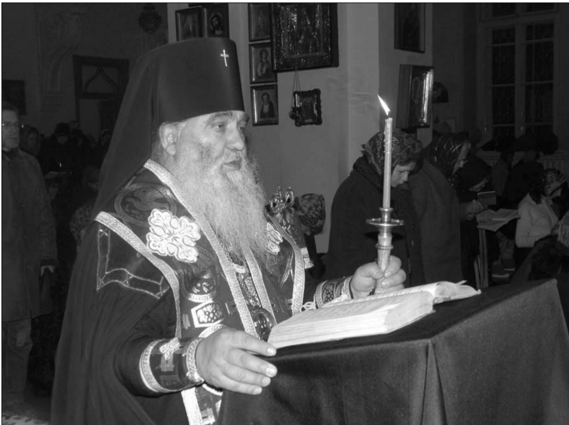
Архиепископ Питирим читает Великий покаянный канон прп. Андрея Критского в кафедральном соборе Рождества Пресвятой Богородицы в первую седмицу Великого поста

Сегодня время Великого поста. Святые отцы Церкви называют это время весной духовной. Ибо "пост - время небесного врачевания, - говорит свт. Амвросий Медиоланский, - время пробуждения души от греховного сна и преступной беспечности о своем спасении. В это время душа каждого из нас, грешных, как бы пробуждается от дремоты, находясь в которой она забыла о своем спасении...". Святая Церковь приходит на помощь к смущенной душе: "пост - мать целомудрия, обличитель грехов, проповедник покаяния!". Поз-