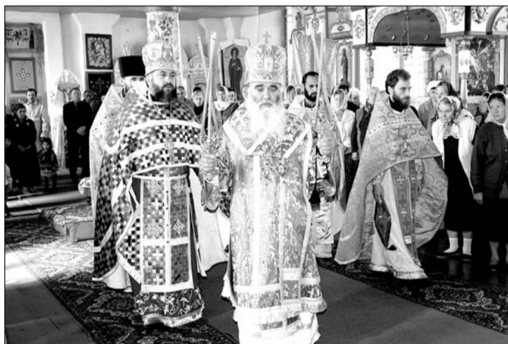
Митрополит Пітирим звершує Божественну літургію в Свято-Покровському храмі

У вересні цього року Піщаний Брід відзначав 200-літній ювілей від дня свого