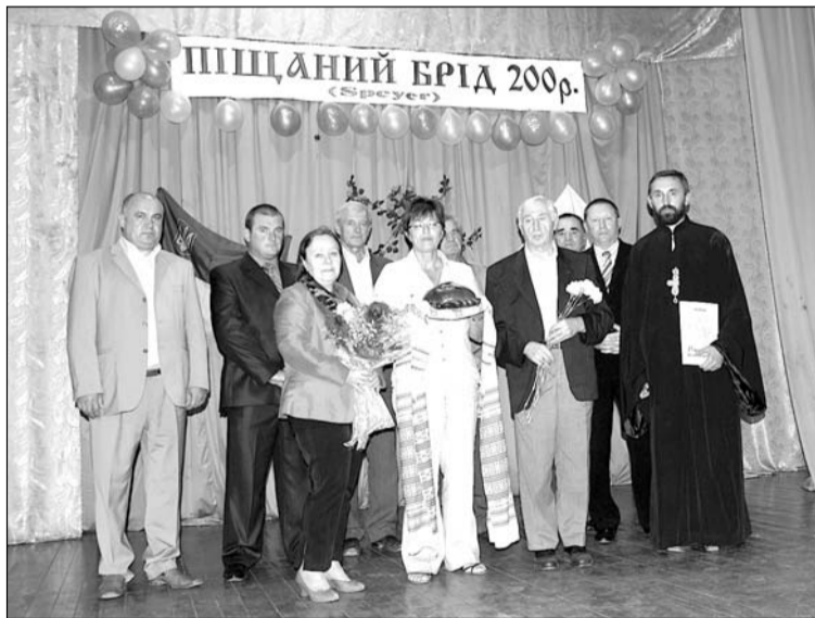
Святкування 200-літнього ювілею села