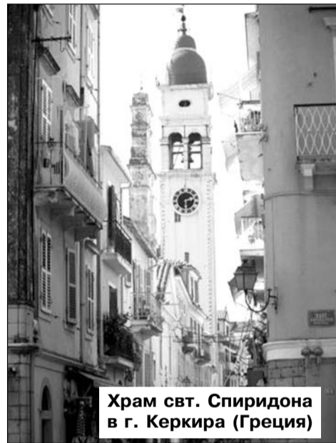
Храм свт. Спиридона в г. Керкира (Греция)

Последуем же и мы, братья и сестры доброму примеру керкирцев и вознесем наши молитвы перед иконой Святителя Спиридона.