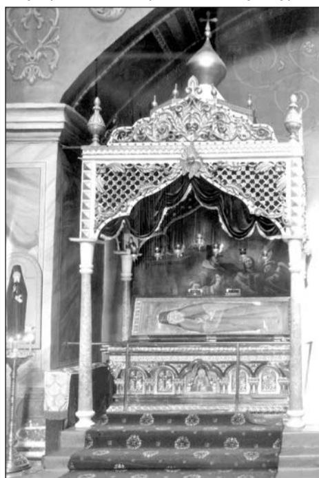
Рака с мощами преподобного Лаврентия Черниговского. Чернигов, Свято-Троицкий кафедральный собор

Когда пришла война, вновь стали открывать храмы и обители. Летом 1941 года Старец собрал всех своих монашествующих чад и устроил женский Троицкий монастырь, на месте мужского монастыря. С самого начала в нем было около семидесяти насельниц. Черниговский Троицкий монастырь сильно пострадал от безбожников, необходимо было многое отстраивать заново. Шла война. Отец Лаврентий с любовью относился ко всякому делу по восстановлению обители, везде и во всем помогал: давал указания печникам, другим мастерам. Ему приходилось работать штукатуром