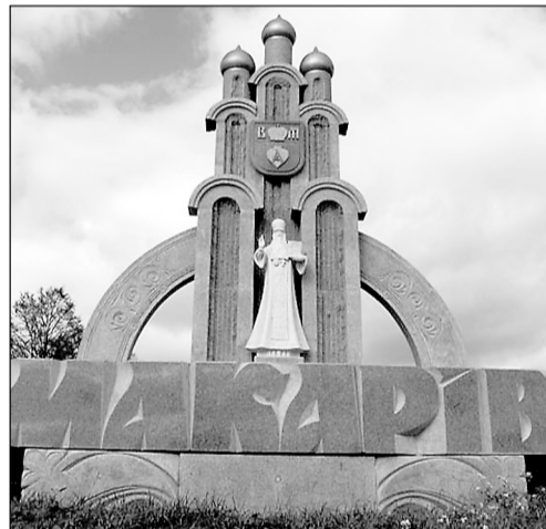
Пам'ятник свт. Димитрію при в'їзді до м. Макарова, де народився святитель