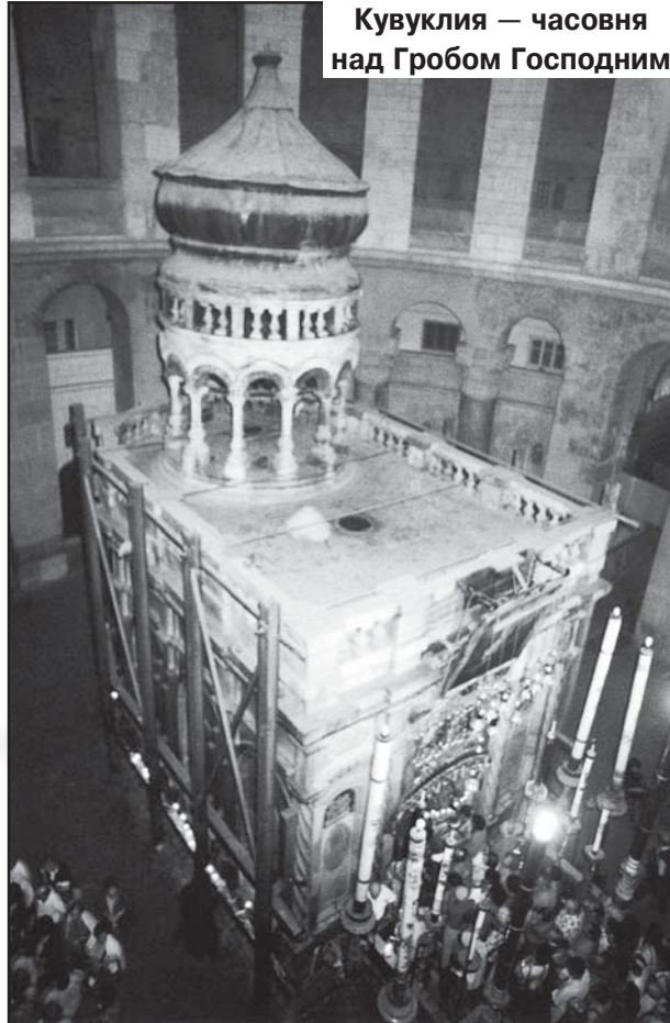
Кувуклия – часовня над Гробом Господним