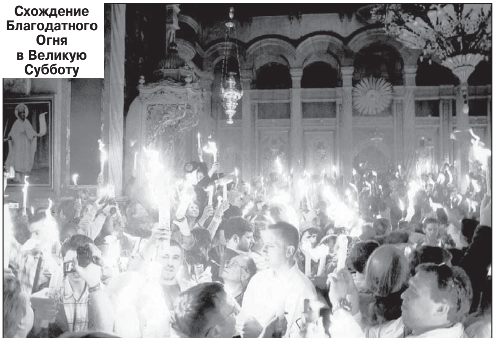
Схождение Благодатного Огня в Великую Субботу

Д ЛЯ ВСЕХ ПОКОЛЕНИЙ христиан Пасха отзывается неописуемой радостью в сердце каждого человека как великолепием праздничного священнодействия, так и множеством своих традиций и обрядов. Начинаясь пасхальная радость с Богослужения. Но какая Пасха может обойтись без сдобных куличей, крашеных яиц, творожных пасок? А что же означают артос, пасхальные яйца, куличи? Давайте попробуем разобраться в основных пасхальных символах.