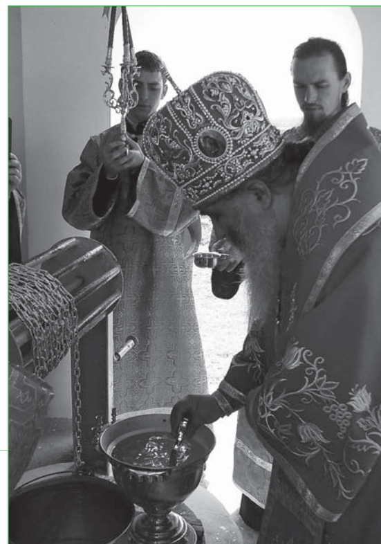
Владыка Питирим освящает воду в монастырском источнике