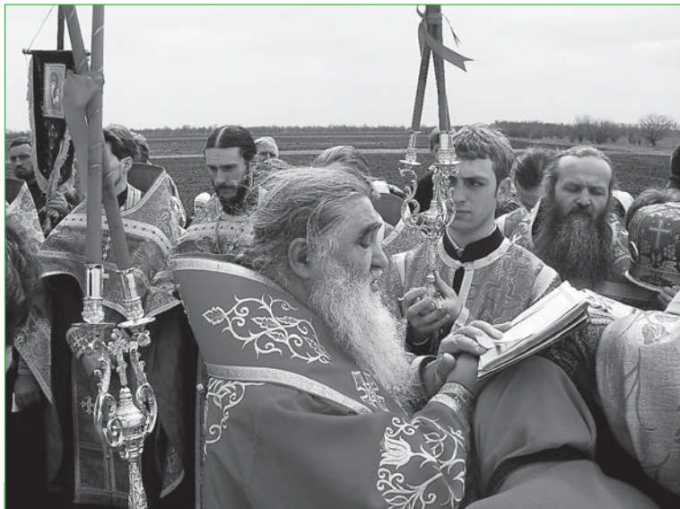
Правящий Архиерей читает Евангелие во время крестного хода в праздник иконы «Животворящий Источник»