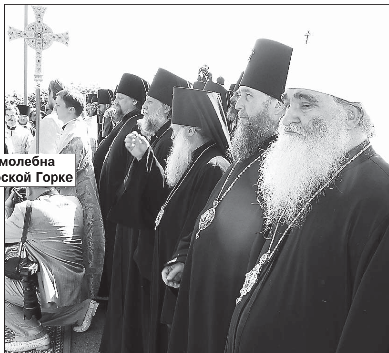
Во время молебна на Владимирской Горке

С 20 по 28 июля в Украине с Первосвятительским визитом пребывал Святейший Патриарх Московский и всея Руси Кирилл. Его Святейшество посетил Одесскую и Днепропетровскую епархии УПЦ, встретился в Крыму с Президентом Украины, а 25 июля прибыл в Киев.