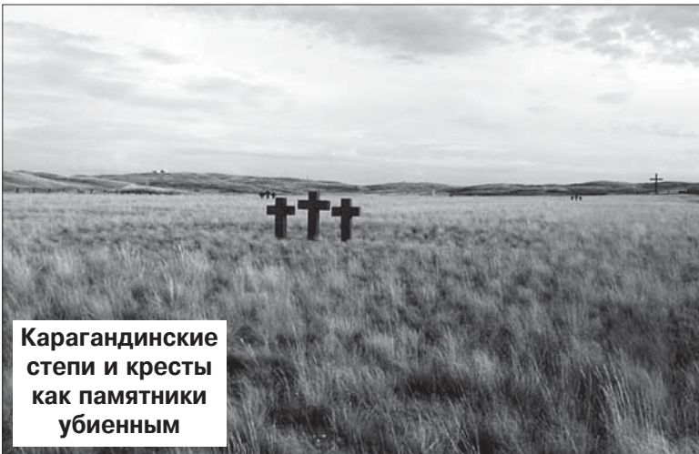
Карагандинские степи и кресты как памятники убиенным

Наступил день, когда Господь призвал будущего страстотерпца на несение крестного подвига в высоком сане священства.