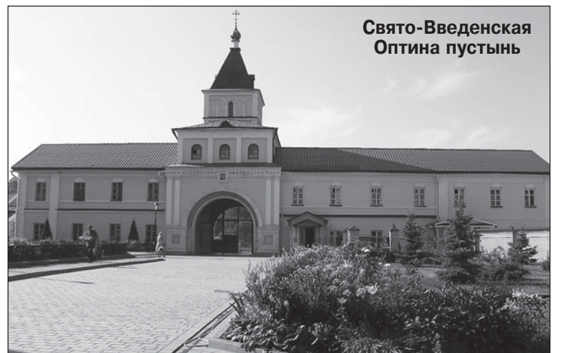
Свято-Введенская Оптина пустынь

Но и без трудов послушания не оставил нас Господь! Слава Господи за уроки Твои! Часть группы получила послушание в трапезной, а другая ее часть сподобилась потрудиться на монастырских пажитях – пололи морковь. А сопровождал наших трудников монах Елисей, наставления и поучения которого запомнили и нам о нем поведали. Если кто видел когда-либо лицо истинно счастливого человека от трудов своих, тот легко представит лица наших братьев и сестер, которые излучали тысячи радужных лучей, их глаза искрились и выплескивали массу энергии. И это все после многочасового труда! Да какой труд был. Рассказали нам сестры, что господь и траву вровень грехам им подал! Долго еще шутила наша группа. Вот и урок для гордых немалый: кто бы ты ни был, – юрист, предприниматель – потрудиться никому и никогда не зазорно. Вот и приходят на память строки из молитвы: «труд в этой жизни приносит благоденствие, а в будущей жизни неизреченное блаженство».