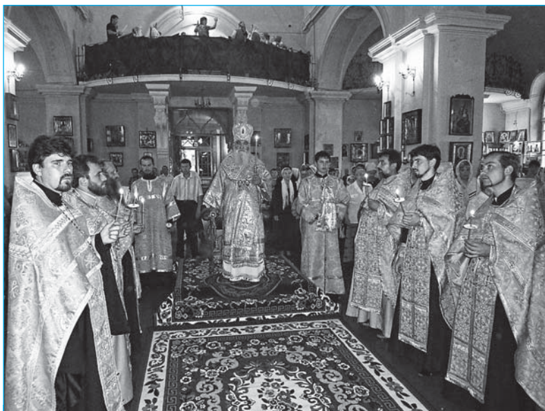
Митрополит Питирим и духовенство собора во время всенощного бдения