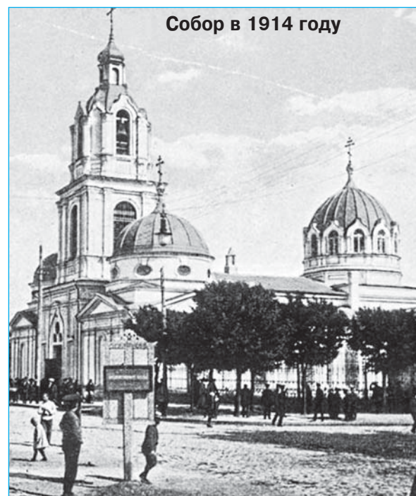
Собор в 1914 году